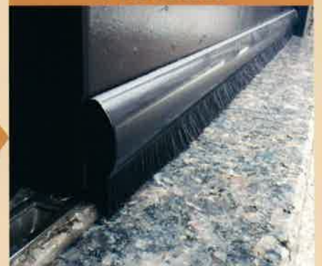
「ドアドアムシヘル」を取り付けることにより、「虫」や「ホコリ」の侵入を防ぎます。